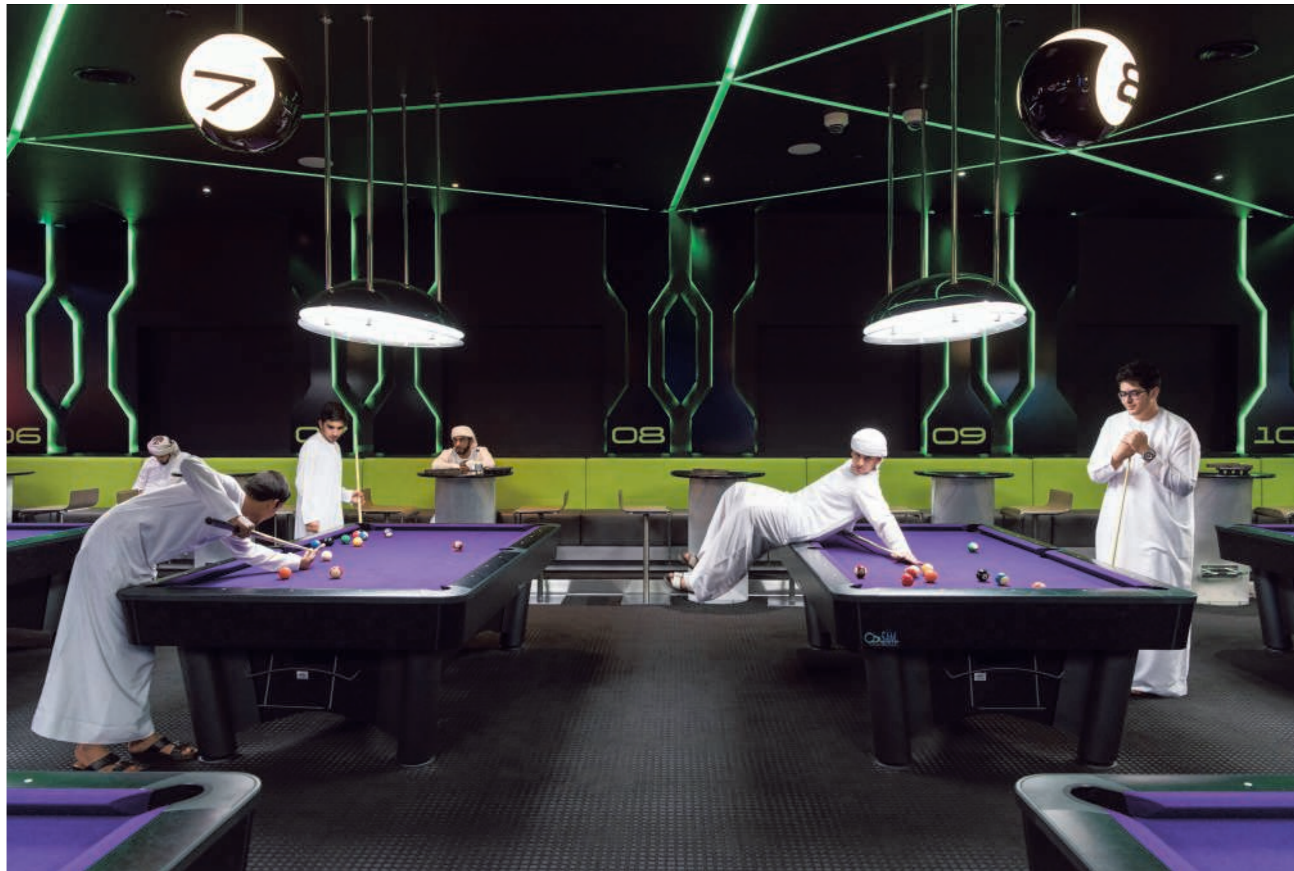
► 2017. Jongens spelen een spelletje poolbiljart in Hub Zero, een entertainmentcomplex en interactief gamingpark in het winkelcentrum City Walk.

Een generische stad. Zonder historische gelaagdheid of karakter. Net dat trok fotograaf Nick Hannes (44) zo aan in Dubai. Toch voor zijn foto-project Garden of Delight . Tussen 2016 en 2018 reisde Hannes vijf keer naar de grootste stad van de Verenigde Arabische Emiraten. "De eerste keer ben je nog zwaar onder de indruk van de skyline. Maar bij elke trip kijk je een beetje verder en dieper. En dan zie je vooral een heel lege, zieloze plek."