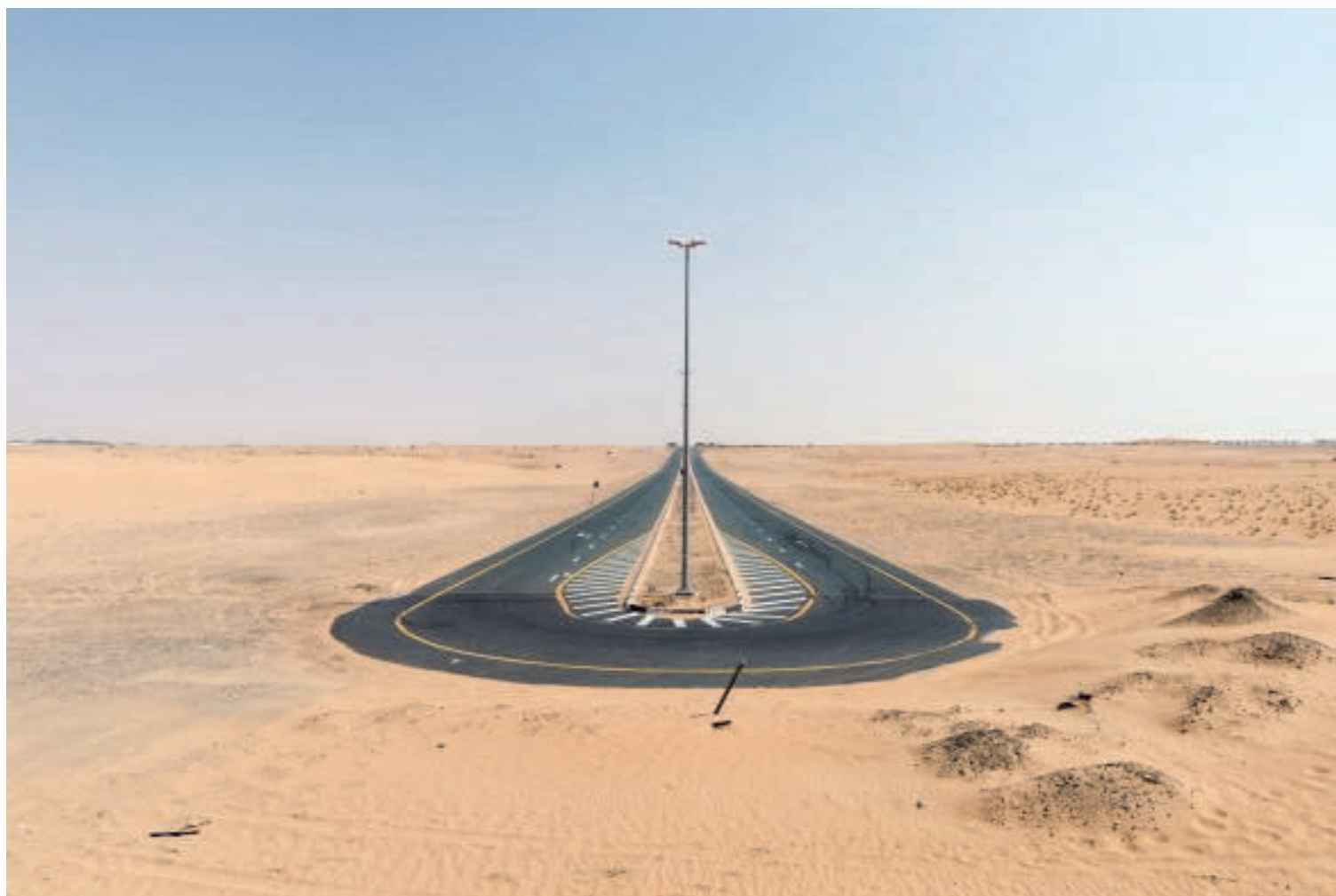
► 2016. Doodlopende weg in de Al Qudra-woestijn? Dat dacht u maar!