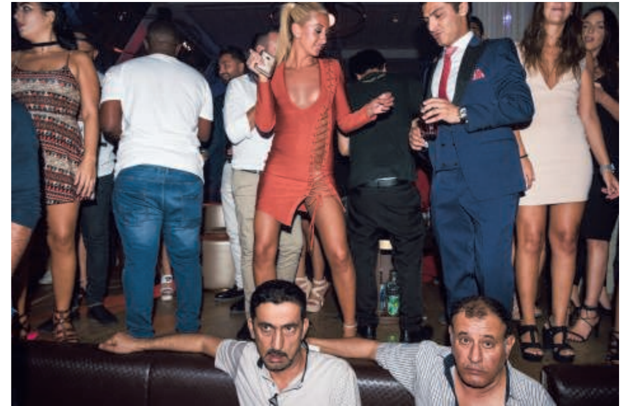
► 2016. Dubai. Niet iedereen amuseert zich te pletter in nachtclub Billionaire Mansion.