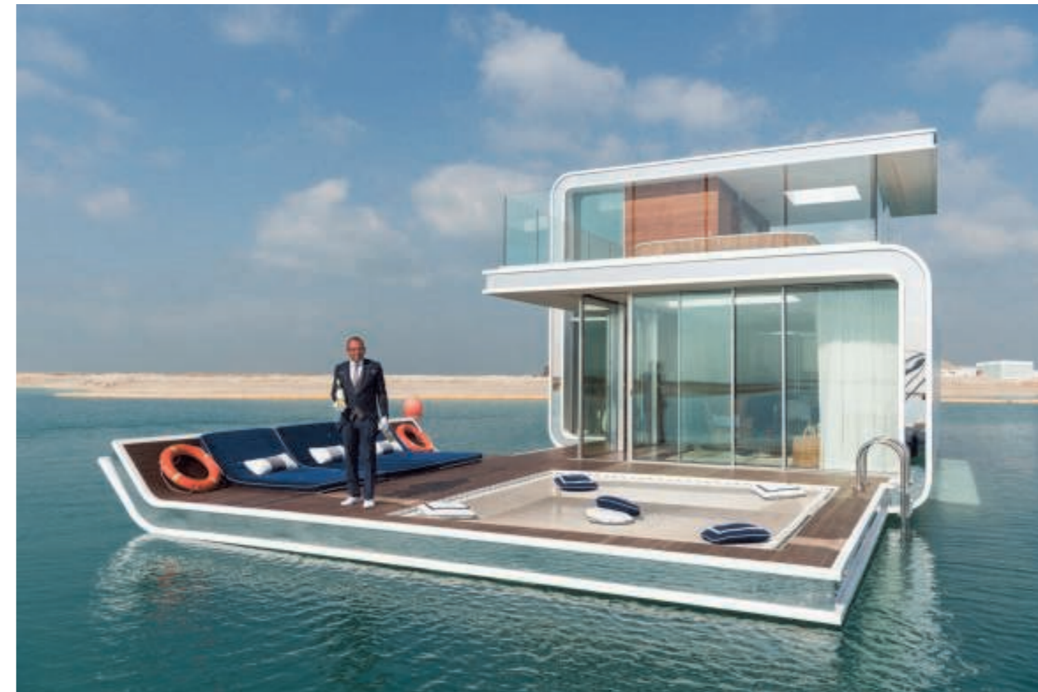
► 2017. Prototype van de Floating Seahorse, een onderwatervakantievilla met butler, in The World, een kunstmatige archipel in de Perzische Golf. In de slaapkamer geniet je van een onderwaterpanorama. Er worden 90 Floating Seahorses gebouwd, te koop voor 2,5 miljoen euro per stuk.