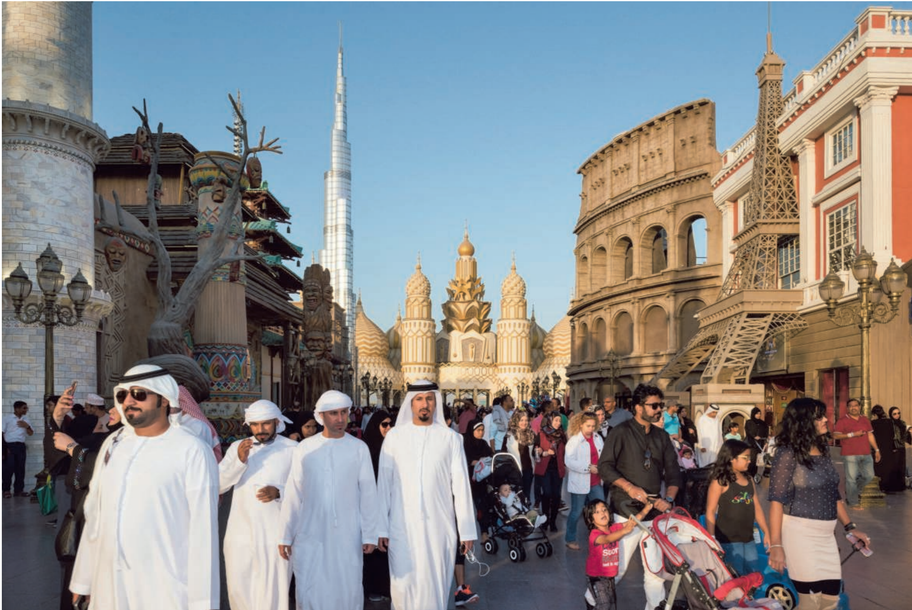
► 2017. Global Village, een amusementspark met reconstructies van bekende gebouwen uit 75 landen, zoals de Eiffeltoren en het Colosseum. Elk seizoen worden de bouwsels verplaatst of vervangen door andere, om ervoor te zorgen dat de reiziger die hier meer dan één keer vakantie houdt, toch telkens een nieuwe ervaring rijker is.