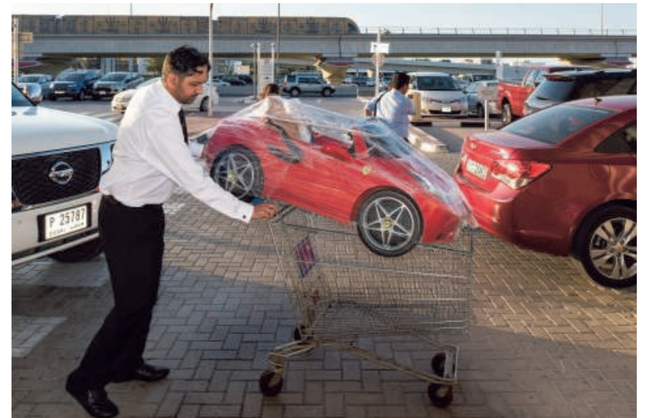
► 2016. Dubai. Papa een Ferrari, dan zoonlief ook eentje. Alleen de ouderwetse winkelwagens vallen wat uit de toon.