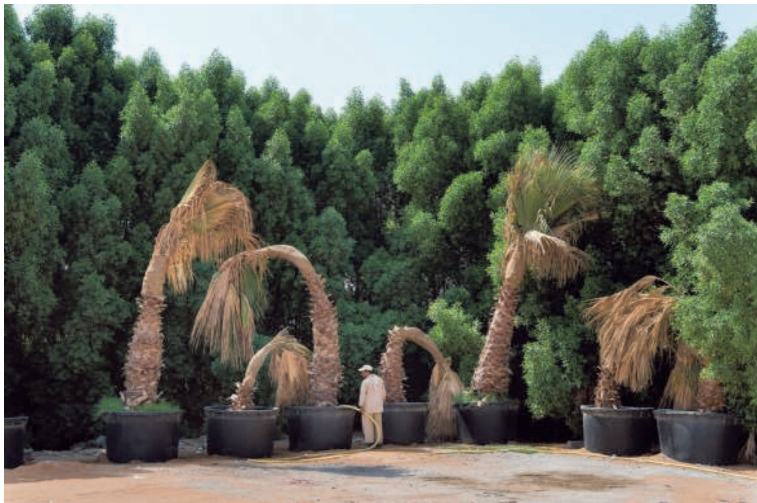
► 2016. Als zelfs de palmen op het parkeerterrein water nodig hebben.