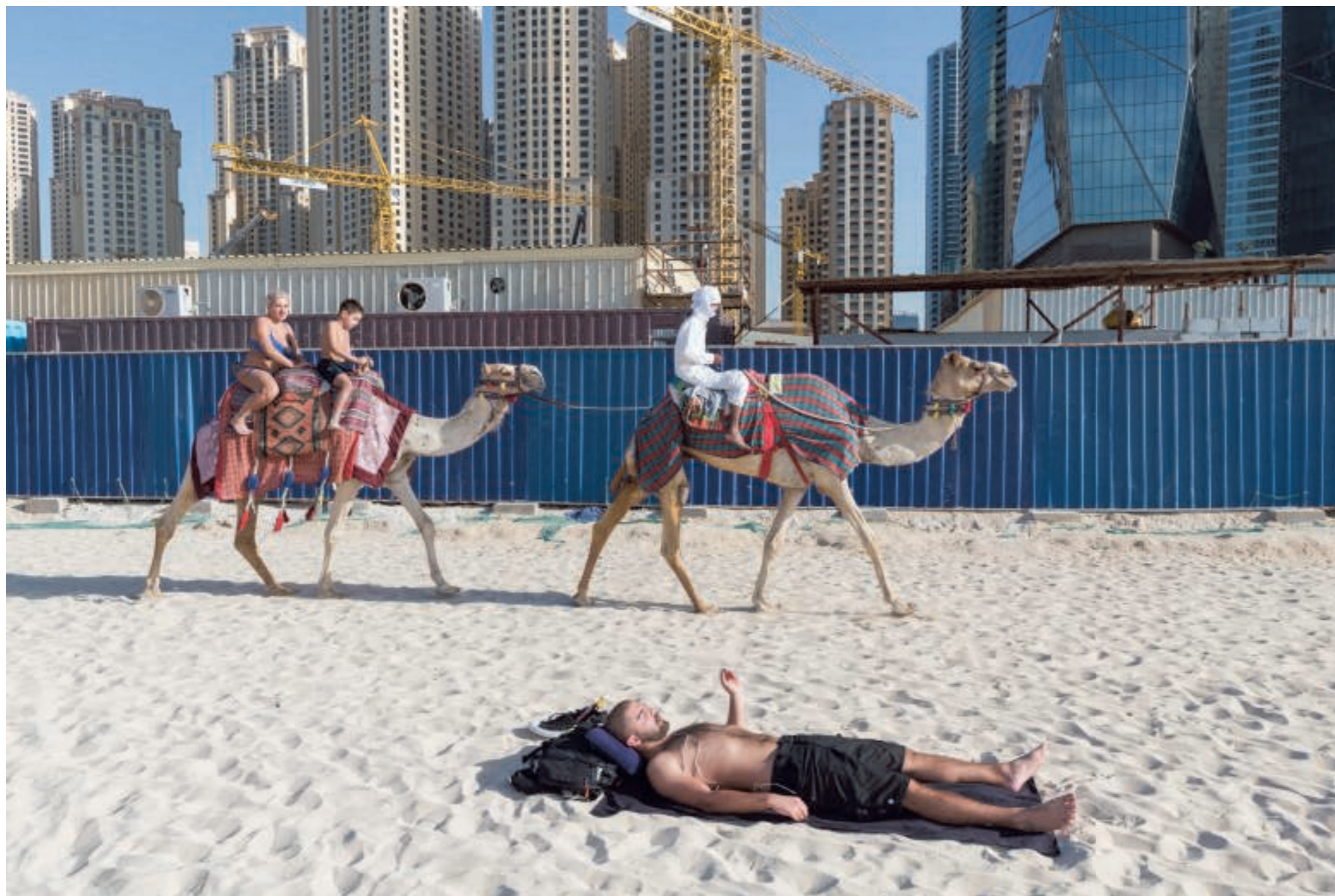
► 2016. Strandvertier in Dubai. Daar kan de Belgische kust nog een puntje aan zuigen.